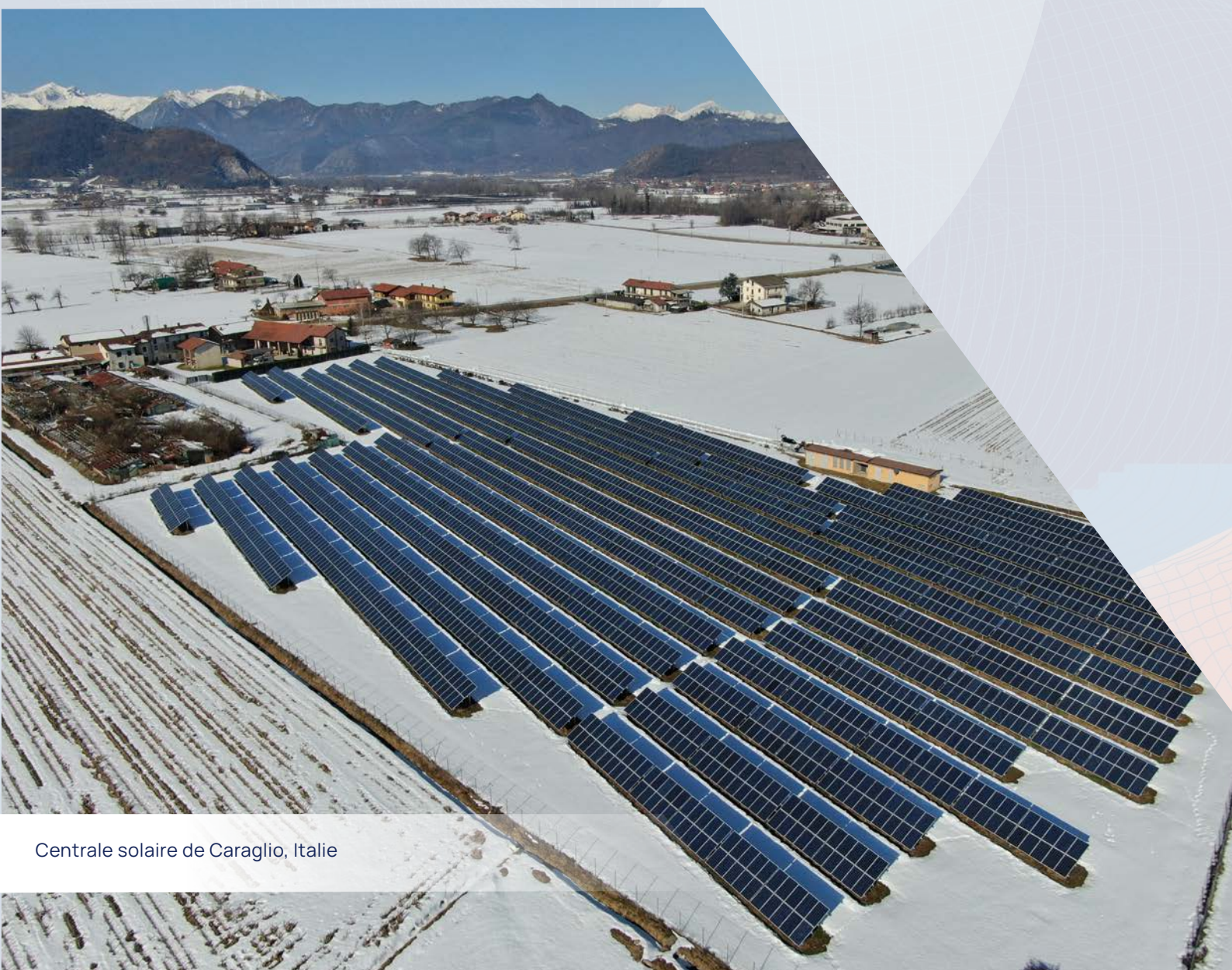
Centrale solaire de Caraglio, Italie

Crédits Contributeurs : Julien Commarieu, Emmy Simons, Isabelle Pinard, Anissa Sidhoum Conception et réalisation graphique : Agence Caroline Benech Crédits images : NW Groupe, Belenergia, Renalfa Solarpro Group, Econergy, Toto Renexia, Caroline Benech, Wladimir Simitch. Date de publication : juin 2023