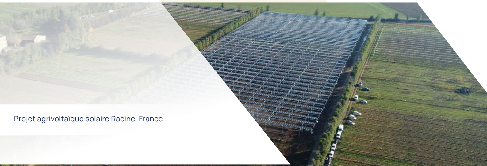
Projet agrivoltaïque solaire Racine, France