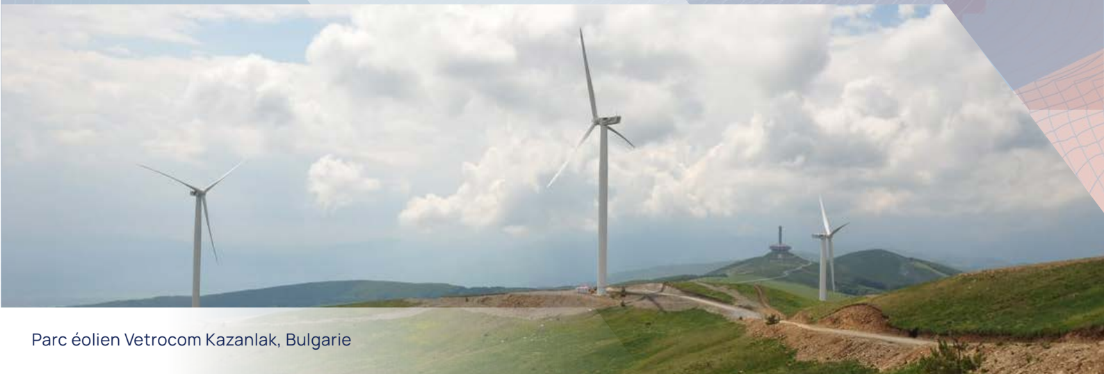
Parc éolien Vetrocom Kazanlak, Bulgarie