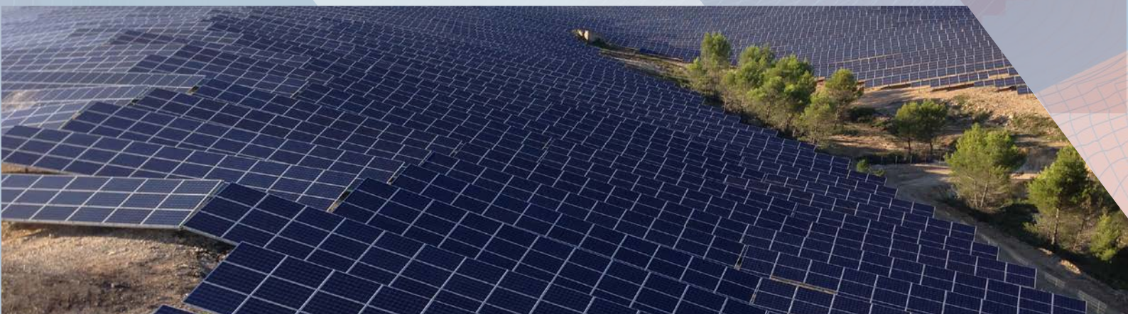
Centrale solaire de Sallèles, Sallèles-Cabardès, France