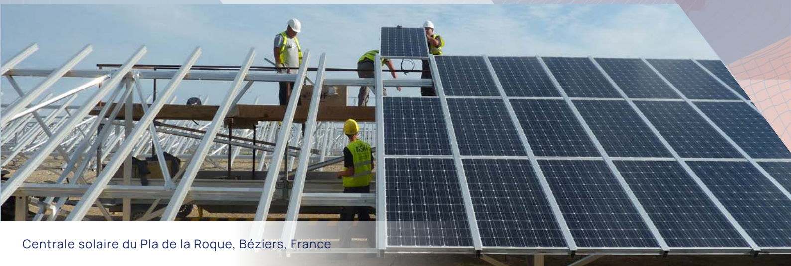
Centrale solaire du Pla de la Roque, Béziers, France