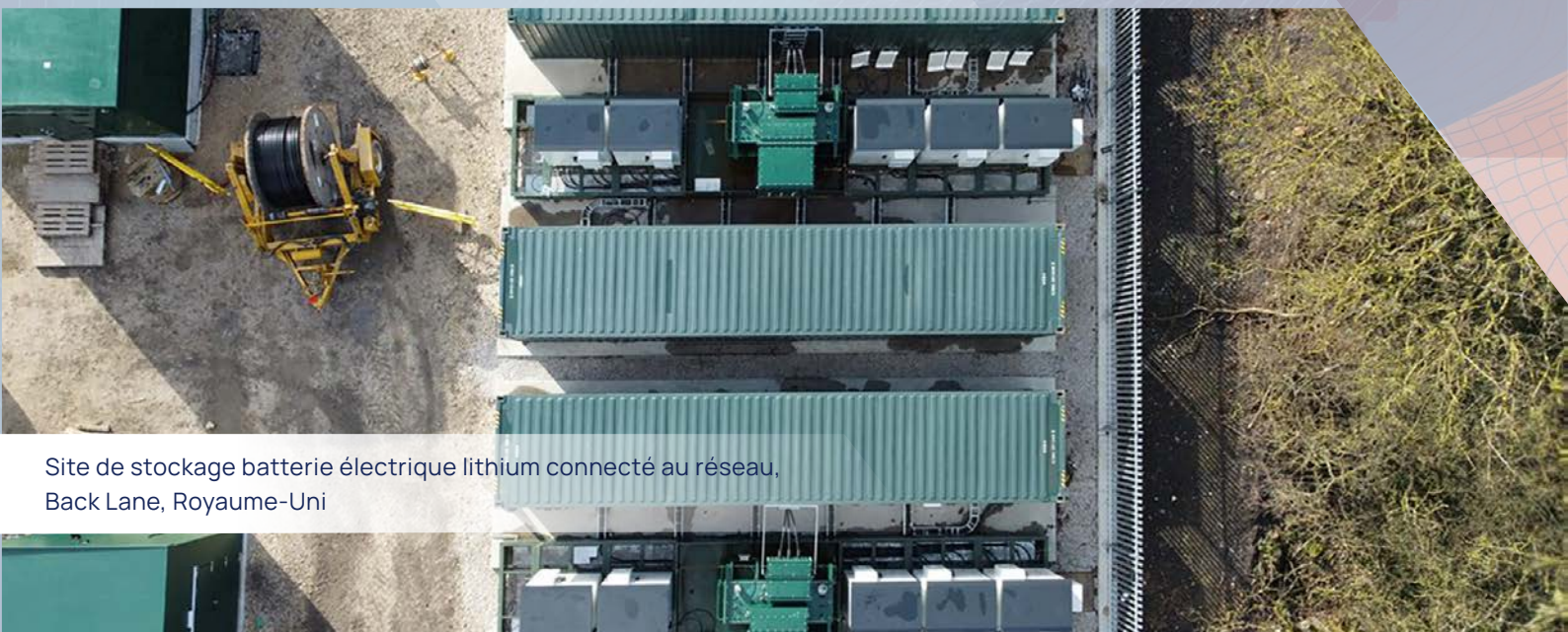
Site de stockage batterie électrique lithium connecté au réseau, Back Lane, Royaume-Uni